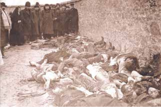
1918-ci il Soyqırımı.

– Bəli, şahid ifadələridir. Ayrı-ayrı yerlərdə var. Demirəm heç yoxdur. Məsələn, bir az Hərbi prokurorluğun, bir qismi ayrı-ayrı adamların arxivində var. Bunlar dağınıq və elmi istifadə üçün ilkin, xam materiallardır. Amma materiallarda gərək 1918-ci il Fövqəladə Təhqiqat Komissiyasının sənədlərində olduğu kimi möhür, imza ola, təsdiqlənə ki, sabah bizi mühakimə etməsinlər. Məsələn, deməsinlər ki, bunlar Xocalıya aid deyil, Azərbaycanın hansısa Aran rayonundan qadını öyrədirib danışdırıblar və s.