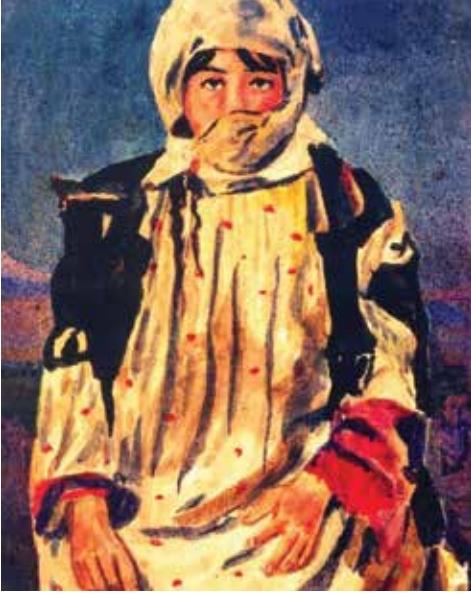
Bəhruz Kəngərli "Qaçqınlar" silsiləsindən.