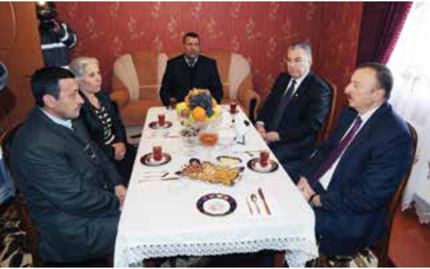
Azərbaycan Respublikasının Prezidenti İlham Əliyev Goranboyda məskunlaşmış Xocalıdan olan məcburi köçkün ailəsinin qonağıdır

– 2003-cü və 2004-cü illərin qışı idi. Sonralar 2007-2008-ci illərdə 2-ci qəsəbə salındı, əlavə 3 qəsəbə salındı. Həmin Ağcakənd qəsəbəsində əlavə 200 ev tikildi. 2010-2011-ci illərdə Goranboyda 1 qəsəbə də salındı. 2014-cü ildə Gəncədə 500 ailəlik bir qəsəbə salındı. Hazırda xocalılar üçün 4 qəsəbə Goranboy rayonunun Ağcakənd qəsəbəsinin ərazisindədir: Aşağı Ağcakənd, Yuxarı Ağcakənd, Böyrü və Meşəli. Bir qəsəbə Goranboydadır, biri də Gəncə-Göygöl yolunun üstündə 600 ailəlik qəsəbədir.