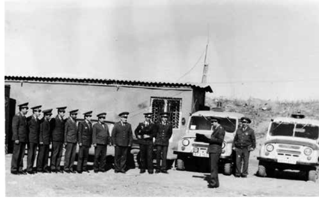
Xocalı şəhər polis idarəsinin əməkdaşları iş başında. 1990-cı il

Bakı hava limanının polis bölməsindən bir neçə nəfər gələrək Xocalıda polis əməkdaşlarına praktik göstərişlər verdi. Limanda abadlıq işləri apardım, silah-sursat saxlamaq üçün xüsusi an-