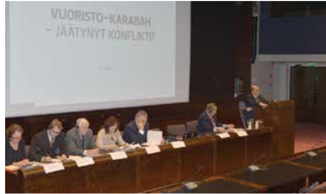
Finlandiya Parlamentində Ermənistan-Azərbaycan Dağlıq Qarabağ münaqişəsi mövzusunda dinləmələr. Noyabr, 2012

ifadələrini, faktları, hadisənin dünya mətbuatındakı əks-sədası ilə bağlı materialları toplayaraq, Azərbaycan, ingilis və rus dillərində “Xocalı soyqırımı (sənədlər, faktlar və xarici mətbuatda)” adlı kitabda çap etdirib. 2007-ci ildə “Xocalı soyqırımı: milyon imza, bir tələb” şüarı altında miqyaslı aksiya çərçivəsində Xocalı soyqırımının beynəlxalq aləmdə tanınması tələbi ilə bir milyon Azərbaycan vətəndaşının imzası toplandı. İmzalar kitab halında çap etdirilərək, qabaqcıl dünya ölkələrinin parlamentlərinə və kitabxanalarına, universitetlərinə göndərildi, BMT, ATƏT, AŞPA, Beynəlxalq Cinayət Məhkəməsinə təqdim olundu. Xocalı hadisələri zamanı öldürülənlərin foto-şəkilləri bəzən ermənilər tərəfindən saxtalaşdırılaraq, erməni qurbanları kimi qələmə verilir. Növbəti erməni saxtakarlığının qarşısını almaq üçün AVCİYA 2010-cu ildə ingilis dilində “Bir faciə haqqında iki foto-söhbət” kitabını çap etdirdi.