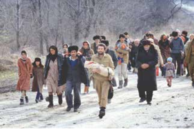
Xocalı sakinləri erməni əsirliyində

limanının məhz burada yerləşməsi idi. Bu səbəbdən Ermənistan silahlı qüvvələrinin əsas məqsədi Xocalıdan keçən Əsgəran-Xankəndi yoluna nəzarət etmək və Xocalıda yerləşən aeroportu ələ keçirmək idi. Bu hərbi-strateji üstünlük həm də Ermənistanın sonrakı işğalçılıq planlarının reallaşmasında əsas rol oynayacaqdı.