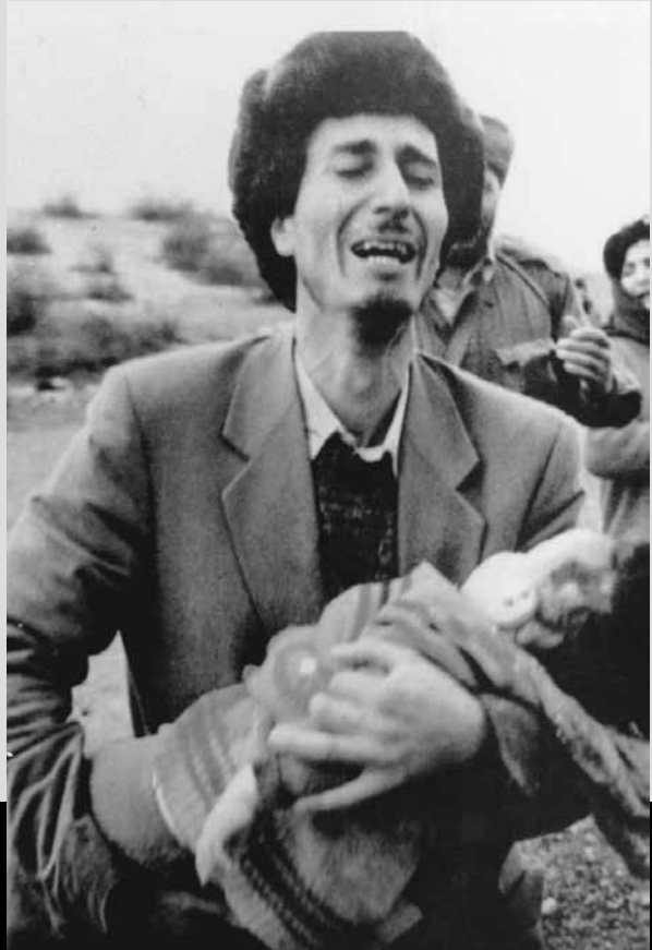
Xocalı - Ağdam yolunda qətlə yetirilmiş azərbaycanlılar

erməni silahlı birləşmələrinin Sovet İttifaqının 366-cı alayının köməyi ilə Azərbaycanın Xocalı şəhərində törətdiyi vəhşilik aktı. 1992 il fevralın 25-dən 26-na keçən gecə erməni silahlı dəstələri SSRİ dövründə Xankəndi (Stepanakert) şəhərində yerləşdirilmiş 366-cı motoatıcı alayının zirehli texnikası və hərbi heyətinin köməkliliyi ilə Xocalı şəhərini zəbt etdilər. Hücumdən əvvəl, fevralın 25-i axşam çağından şəhər toplardan və ağır zirehli texnikadan şiddətli atəşə tutulmağa başladı. Nəticədə şəhərdə yanğınlar baş verdi və fevralın 26-sı səhər saat 5 radələrində şəhər tam alova büründü. Belə bir vəziyyətdə, erməni əhatəsində olan şəhərdə qalmış təqribən 2500 nəfər əhali yaxınlıqdakı azərbaycanlılar məskunlaşmış Ağdam rayonunun mərkəzinə çatmaq ümidi ilə şəhəri tərk etməyə məcbur oldu. Ancaq bu niyyət baş tutmadı. Şəhəri yerlə yeksan etmiş erməni silahlı dəstələri və motoatıcı alayın hər-