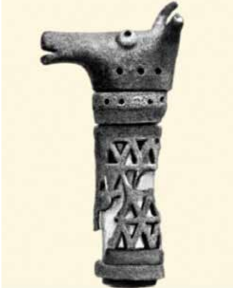
Bürünc öküz başı. Xocalı. e. ə. IX əsr

beş tip kurqanın doğrudan da mövcudluğunu və onların vəziyyətinin nə yerdə olduğunu müəyyənləşdirmək istəyirdim. İyirmiyə gədər abidəni öyrəndim. Və Reslerin, Meşaninovun hesablamasına düşməyən yeni bir abidələr qrupu tapdım. Əsgərlə Xocalını ayıran Bozdağ var. Bozdağın ətəyində, çınqıllıqlar olan yerdə adi qəbirlər mövcuddur. Onlar dövr etibarilə hardasa gəlib e. ə. VIII-VII əsrlərə çatır. Bu qəbirləri üç yerə böldüm. Çünki kurqanlar özünün formasına görə torpaqdir, torpaq kurqanının ortasında isə çala var, çala boşdur. Digərində çala şərq hissəsində, başqa birində qərb hissəsindədir. Amma o savadsız deyilən