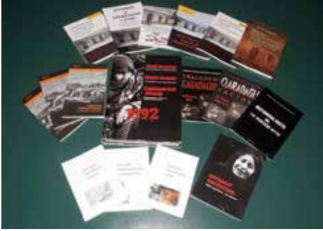
AVCİYA-nın Qarabağ mövzusunda bəzi nəşrləri

- AVCİYA-nın Ermənistanın Azərbaycana təcavüzü ilə bağlı layihələrindən danışanda ön plana çıxan əsas layihələrdən biri də “Sərsəng SOS”dur. Bu layihə ilə bağlı həyata keçirilən tədbirlər həqiqətən Ermənistan dövlətini lərzəyə gətirdi.