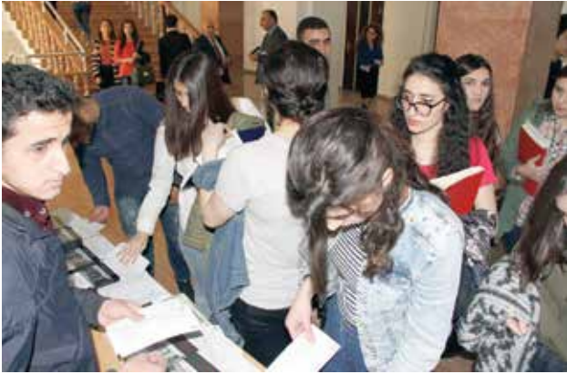
Petisiya ilə bağlı Azərbaycanın 19 universitetində görüşlər keçirildi

Birincisi, petisiyaya bütün Azərbaycan xalqı, bütün türk dünyası qoşuldu və zəruri olan imza sayından bir neçə dəfə artıq imza toplandı. İkincisi, Ağ Evin müraciətimizə cavabı Azərbaycan üçün böyük bir siyasi dəstək idi. ABŞ bu cavabında Dağlıq Qarabağ ətrafı ərazilərin Azərbaycanın nəzarətinə qaytarılmasına və Dağlıq Qarabağın statusunun müəyyən olunmasına dair təcili danışıqlar aparmağa çağırış etdi. Ağ Evin cavabında deyilirdi: “Biz tərəfləri münafiqşənin hərtərəfli nizamlanmasına, o cümlədən Dağlıq Qarabağ ətrafı ərazilərin Azərbaycanın nəzarətinə qaytarılmasına və Dağlıq Qarabağın statusunun müəyyən olunmasına dair təcili danışıqlar aparmağa və təmkinli olmağa çağırırıq”. Petisiya Ağ Evin “Biz Xalqıq” platformasının çoxmilyonlu izləyicisinin diqqətini bir daha bu məsələyə yönəltdi, Ermənistanın işğalçı siyasəti yenidən aktuallaşdırıldı. Bütövlükdə bu petisiya Azərbaycan xalqının informasiya müharibəsində çox mühüm intellektual qələbəsi idi.