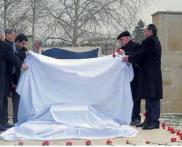
1992-1993-cü illərdə Qarabağ müharibəsində itkin düşmüş soydaşlarımızın xatirəsini əbədləşdirən abidənin açılış mərasimi. Yanvar, 2014